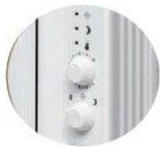
Ενσωματωμένο , εύχρηστο πληκτρολόγιο