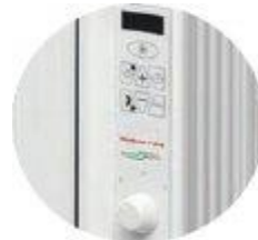
Εύχρηστο πληκτρολόγιο με προγραμματιστή